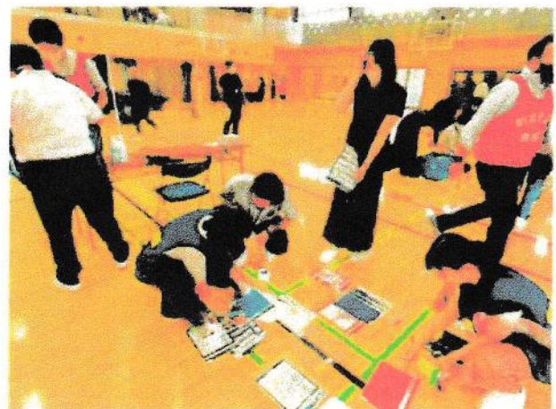
開設運営シミュレーション訓練