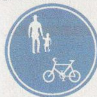
「普通自転車等及び歩行者等専用」標識

特例特定小型原動機付自転車以外の電動キックボード等は、路側帯や歩道を通行できません。