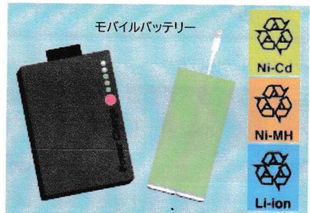
モバイルバッテリー