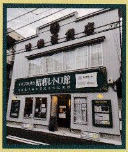
味楽百貨店とは、トキワ荘通りに今日まで残っている、昭和20年代に建てられた戦後マーケット(戦後復興期以降に現れた、複数の店舗で構成される低層の商業施設)。