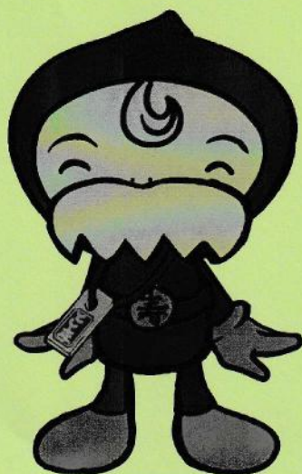
豊島区民社協キャラクター ふくじい