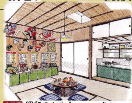
企画展 昭和のおもちゃコレクション