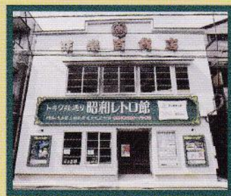
味楽百貨店とは、トキワ荘通りに今日まで残っている、昭和20年代に建てられた戦後マーケット(戦後復興期以降に現れた、複数の店舗で構成される低層の商業施設)。