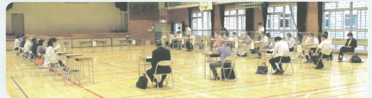
第1回 考える会のようす（令和2年7月31日）